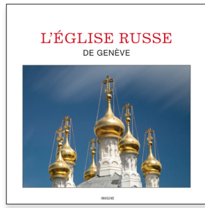
РУССКАЯ ЦЕРКОВЬ В ЖЕНЕВЕ Édition en russe